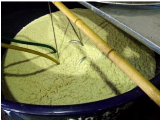
一次仕込み、黄麹の酒母です